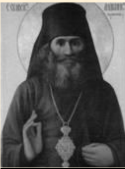
Свмч. Андроник (Никольский) 1870 – 1918, архиепископ, почётный Председатель Новгородского и Пермского отделов Союза Русского Нар.