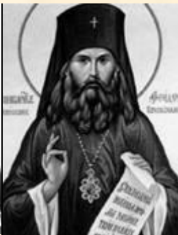
СВМЧ. ФЕОДОР (ПОЗДЕЕВСКИЙ) 1876 – 1937, архиепископ, Председатель Тамбовского отдела Союза Русского Народа