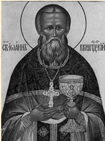
Св. прав. Иоанн Кронштадтский 1829 – 1908 Духовный наставник Союза Русского Народа