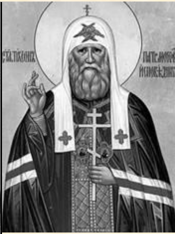
Св. ПАТРИАРХ ТИХОН 1865 – 1925 почётный Председатель Ярославского отдела Союза РН