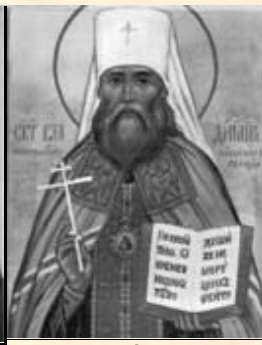
Свмч. Владимир (Богоявленский) 1848 – 1918, митрополит, попечитель Союза Русского Н и Председатель совещаний в Москве, Петрограде, Киеве.