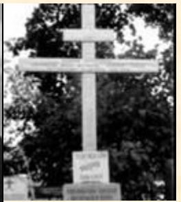
КРЕСТ У ХРАМА ВСЕХ СВЯТ. В МОСКВЕ В ЧЕСТЬ УБИЕННЫХ 23.08.1918 Г. СВМЧ. ИОАННА ВОСТОРГОВА И ЕФРЕМА (КУЗНЕЦОВА) ЕП. СЕЛИНГИНСКОГО ОРГАНИЗАТОРА ЗАБАЙКАЛЬСКОГО ОТДЕЛА СОЮЗА РУССКОГО НАРОДА

О становлении Союза Дубровин вспоминал: «Работали все и несли свой труд идейно, без ожидания какого-либо вознаграждения, благодаря чему Союз разрастался незаметно, но быстро; волна оскорбленного чувства за поруганную Родину быстро разливалась по всему пространству униженной России, охватывала умы и сердца во всех слоях населения и привлекала к Союзу массу новых единомышленников».