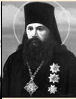
СВМЧ. МИТРОФАН (КРАСНОПОЛЬСКИЙ) 1869 – 1919, архиепископ, принимал активное участие в делах Союза Русского Народа