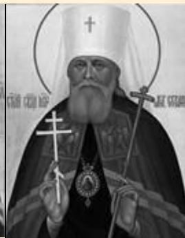
Свмч. Серафим (Чичагов) 1856 – 1937, митрополит, почётный Председатель Аккерманского отдела Союза Русского Народа.

Но вот уже 100 лет минуло, как черносотенцев ругают, на чем свет стоит. И даже сегодня! Кто же сегодня в России так ненавидит русских людей, вступающих на защиту своего родного Очага? Победенные ими тевтонцы? Татары? Ляхи? Да нет же! Нет у нас нынче с ними вражды. Кто же они такие эти современные ненавистники Православной веры и русской народной традиции? А это – сегодняшние идейные наследники все тех же революционеров – кадетов, эсеров, меньшевиков и большевиков, главных ненавистников и разорителей России. Почти все они люди либо не русские, либо давно утратившие свою национальную принадлежность. Слово дрессированные обезьяны исполняют они чужую злую волю, являясь переносчиками чужеродных идей: либерально-западных (по еврею Керенскому) или же марксистско-ленинских (по евреям Марксу и Ленину).