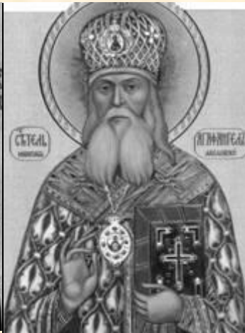
Св. АГАФАНГЕЛ (ПРЕОБРАЖЕНСКИЙ) 1854 – 1928 МИТРОПОЛИТ ТАК ЖЕ, почётный Председатель Ярославского отдела Союза РН

«В России черносотенное духовенство!» – сокрушалась либеральная и левая пресса, стремясь при- дать зловещий смысл слову «черносотенцы»: «погромщики, мясники, человеконенавистники». Так в начале XX века стараниями врагов русского народа было искажено истинное понятие о Черной Сотне. Но в сло- варе В. Даля « черная сотня » означает – простолюдины и ничего более (в Московской Руси – неслужилое податное сословие, т.е. не состоящее на государственной службе).