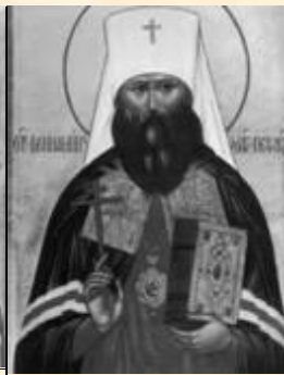
Свмч. Вениамин (Казанский) 1873 – 1922, митрополит, духовный наставник Петроградского отдела Союза Русского Народа.